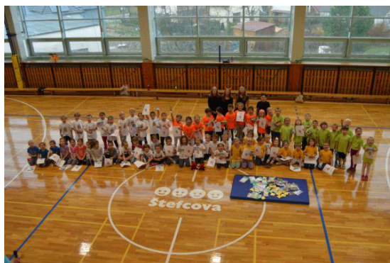
MŠ - Čertovské hrátky