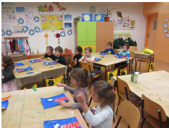
Broučci - tvoření

Jednotná písemná přijímací zkouška na maturitní obory středních škol se koná formou písemného testu z českého jazyka a matematiky, a to ve dvou termínech: 12. dubna 2019 a 15. dubna 2019. Žákům se započítá lepší výsledek zkoušky! Jednotná písemná přijímací zkouška z českého jazyka a matematiky pro žáky 5. a 7. tříd se letos koná ve dvou termínech, a to 16. dubna 2019 a 17. dubna 2019. Další informace, aktuality a podrobnosti na webu školy v sekci Poradenské služby .