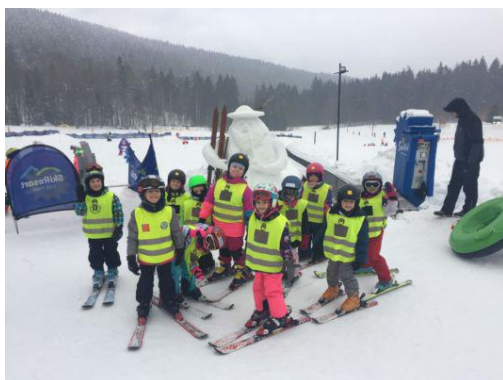
MŠ - Pohádkové lyžování

Nově nastupujícím dětem a jejich rodičům nabízíme účast v klubu pro nejmenší Plamínek . Schůzky plné her a tvoření budou probíhat v dubnu až v červnu. Bližší informace budou na webu MŠ a na letáčkách.