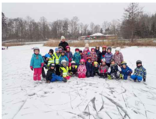
MŠ - bruslení na Biříčce