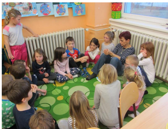
Broučci - jaro