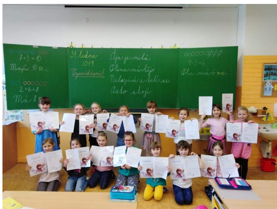
První vysvědčení prvňáčků