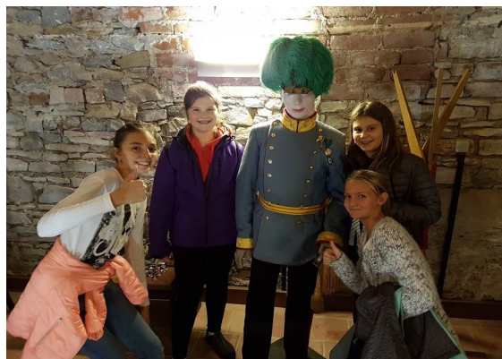
Výstava k roku 1866