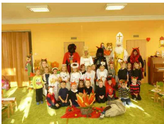
MŠ - Čertovská návštěva