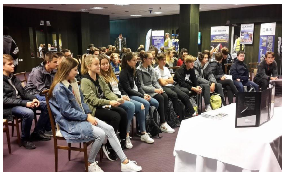
Burza středních škol