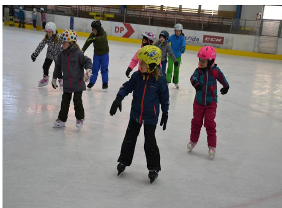
Sportovní akce - bruslení