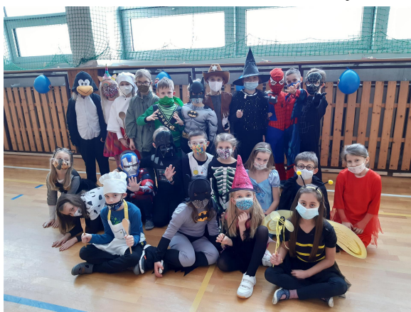
Karneval 2. A

H) Třída 5. C - Gladiátor – Stříbrný rybník - 15. 9. 2021 - exkurze do Hvězdárny a Planetária v Hradci Králové - listopad