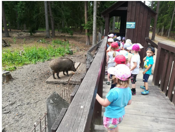
Nejmenší školáčci na výletě v lese

Z nadstandardních aktivit v tomto školním roce nabízíme Ekologicko - pěstitelský kroužek a skupinovou i individuální logopedickou péči pro všechny třídy, pro mladší děti keramické tvoření, Šikuláčka (netradiční výtvarné a pracovní činnosti), Taneční hrátky s pohádkou, pro starší děti Veselé písčání na flétnu, Atletické hrátky, plavecký kurz, Hravou angličtinu, Lerngymnastiku a pěvecký sbor „Kosáček“. Opět plánujeme bruslařský kurz na zimním stadionu v Třebechovicích pod Orebem, pětidenní Pohádkové lyžování v Jánských Lázních a na jaře pro předškoláky školku v přírodě v Krkonoších. Chtěli bychom navázat i na úspěchy ve výtvarných, hudebních a sportovních soutěžích. Snad nám situace dovolí uspořádat i tradiční sportovní soutěže pro předškoláky z ostatních hradeckých mateřských škol: Čertovské hrátky, Plavecké štafety a Atletické hrátky.