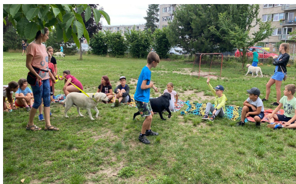
Akce příměstského tábora