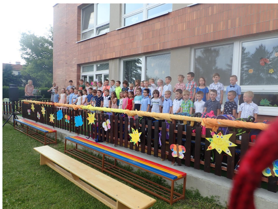
Pasování školáků - pěvecký sbor Kosáček

Ohlédneme-li se za minulým školním rokem, tak provoz mateřských škol koronavirová pandemie zasáhla asi nejméně . Během jarní čtyřtýdenní uzavírky MŠ jsme si s předškoláky vyzkoušeli povinnou distanční výuku – děti dostávaly vědomostní, dovednostní i pohybové úkoly „na doma“ i rodinné pobyty venku. Z důvodu uzavření kulturních a sportovních „areálů“ jsme ale museli omezit tyto činnosti, neproběhl ani tradiční lyžařský a bruslařský kurz ani škola v přírodě. V červnu jsme si užili zahradní slavnost, kde vystoupil i pěvecký sbor Kosáček a „opasovali jsme na školáky“ padesát předškoláků. K velkým úspěchům loňského školního roku patří udělení certifikátu „eTwinningová škola“ za realizaci mezinárodních projektů a vítězství předškoláků ve výtvarné soutěži „Pohádkové leporelo – Kočičí pohádka“. I začátkem července a ve druhé polovině srpna byla školka plná dětí, a to nejen našich, ale i z ostatních malšovických školek. V novém školním roce jsme mezi sebe přivítali 50 nových kamarádů, především těch nejmenších tříletých.