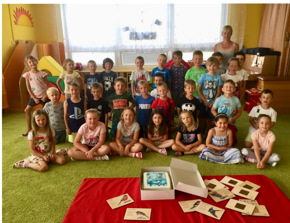
Výtvarná soutěž Pohádkové leporelo