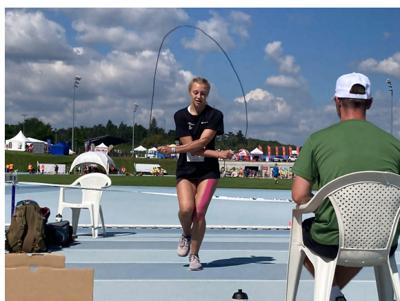
Republikové finále OVOV - září 2021