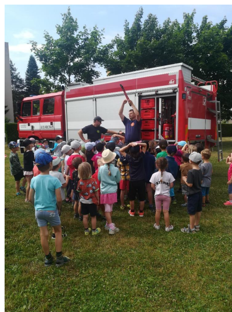
Projektový den - Povolání hasiče

Pokud nás hygienická opatření neomezí, plánujeme na první pololetí školního roku pravidelné divadelní představení, návštěvy hradeckých knihoven, pohádkové cesty lesem, návštěvu výstavy železničních modelů na hradeckém nádraží, Bramboriádu, Drakiádu, Posvícení, Dýňobraní, Strašidelnou zahradu, oslavu sv. Martina, Mikulášskou nadílku, adventní výlety, vánoční tvořivé dílny s třídními besídkami, vánoční nadílku, Tříkrálový den, Masopust, karneval a další překvapení.